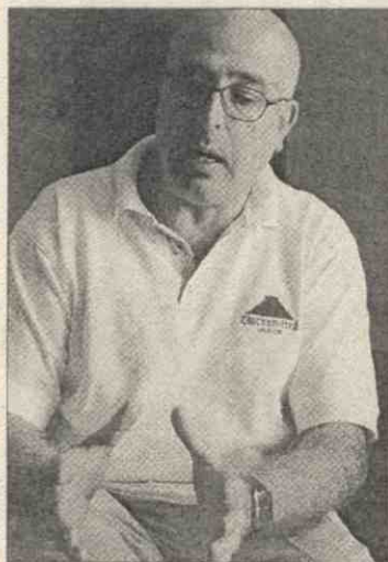
▶ G. Auletta.

Al segle XVIII es produeix el trencament definitiu. Però el