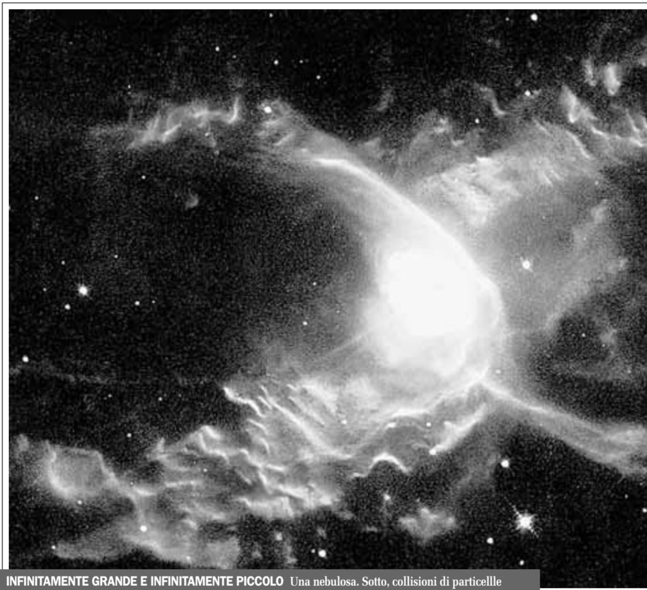
INFINITAMENTE GRANDE E INFINITAMENTE PICCOLO Una nebulosa. Sotto, collisioni di particelle

La quantotecnica offre solo opportunità o presenta anche aspetti pericolosi? «Non esistono tecnologie buone o cattive in sé. O meglio: tutte le tecnologie sono al tempo stesso buone e cattive, dipende dall'uso che se ne fa. Ogni grande innovazione, proprio quando è tale, comporta sempre degli immensi rischi e naturalmente rappresenta al tempo stesso delle straordinarie opportunità. Con le tecnolo-