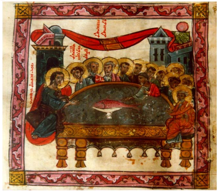
"The Mystical Supper" (miniature from the Monastery Mar Gabriel in Tur Abdin)

Vat. Syr. 66, foglio 101 recto [numerato 103] (RETROVERSIONE LATINA) « Super corpus . Dominus noster Iesus Christus, nocte qua traditurus erat et pridie quam pateretur, accepit panem hunc sanctum in manus suas puras et sanctas, et elevavit oculos suos in caelum, et gratias egit Deo Patri, factori omnium, et benedixit ac fregit deditque discipulis suis et dixit: Accipite, comedite vos omnes ex hoc pane: HOC EST IN VERITATE CORPUS MEUM. Et elevans aliquantulum calicem supra altare dicit super calicem : Et similiter, postquam coenatum est, accepit hunc calicem in manus suas puras, et gratias egit, et benedixit, deditque discipulis suis et dixit: Accipite, bibite vos omnes ex hoc calice; et quotiescumque comederitis hunc panem et biberitis etiam hunc calicem, memoriam meam facietis: HIC EST IN VERITATE CALIX SANGUINIS NOVI TESTAMENTI, QUI PRO VOBIS ET PRO MULTIS EFFUNDETUR IN VENIAM DEBITORUM ET IN REMISSIONEM PECCATORUM. Et hoc erit vobis pignus in aeternum. Et deinde : Gratia Domini nostri Iesu Christi et caritas Dei Patris et communicatio Spiritus Sancti sit vobiscum, nunc. Et signat seipsum ».