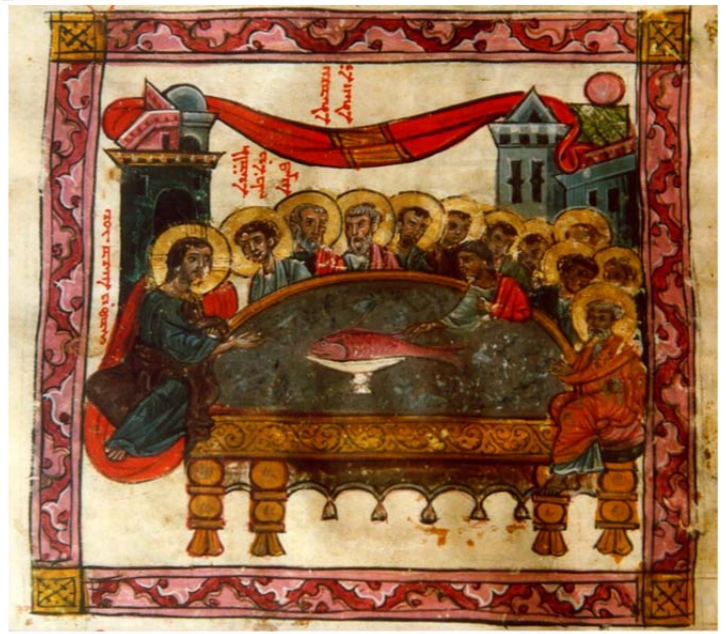
"La Cena Mistica" (miniatura del Monastero Mar Gabriele di Tur Abdin)